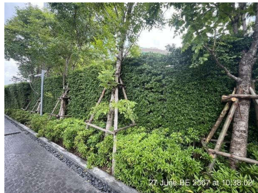
รูปที่ 1-1 สถานภาพทั่วไปของโครงการ โครงการ แชนเตอร์วัน โฟลว์บางโพ (Chapter One Flow Bangpo) ในเดือนมิถุนายน พ.ศ.2567 ระยะดำเนินการ